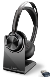
VOYAGER FOCUS 2 UC MIT LADESTATION