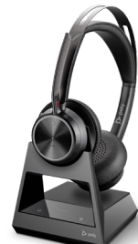
VOYAGER FOCUS 2 OFFICE