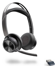
VOYAGER FOCUS 2 UC